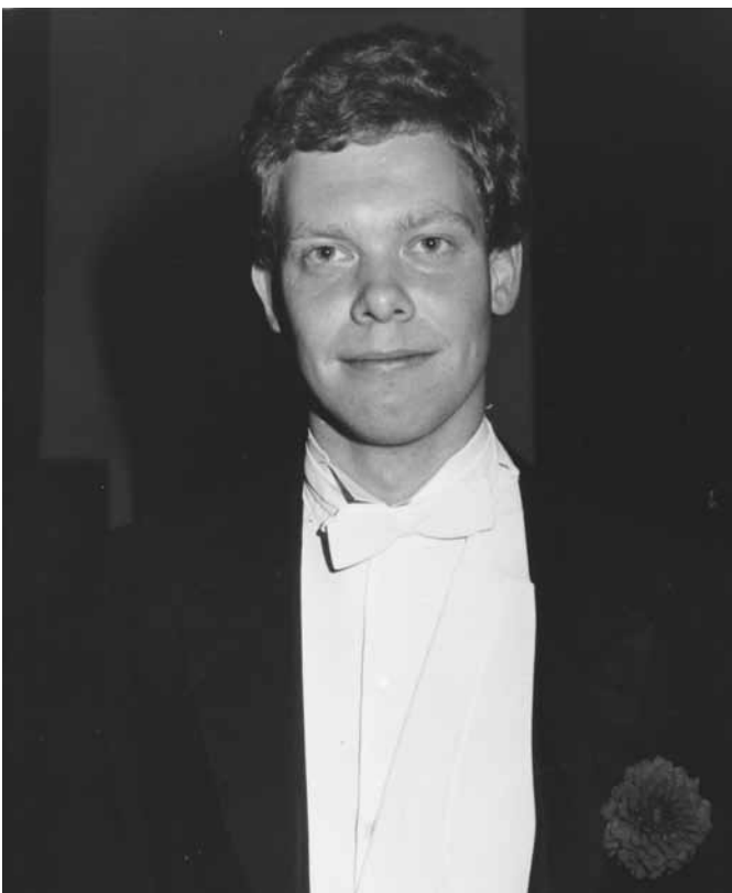
Uw voorzitter in vroeger tijden